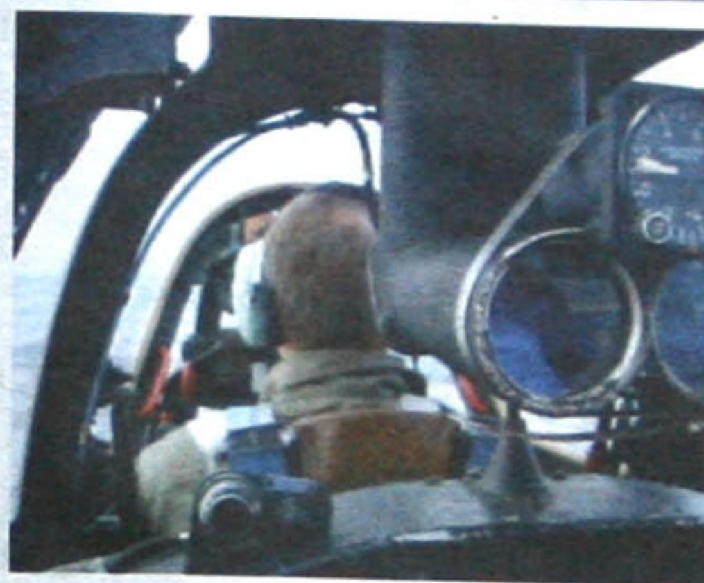
Evig unge Niels Egelund inviterer på flytur med innlagt loop og full rulle over det sjællandske landskap i sitt jagerfly, en Fouga CM 170.