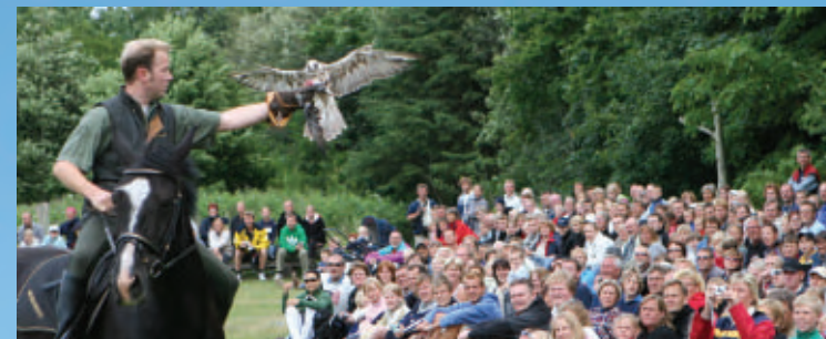
Falkonerrytter træner jagtfalk